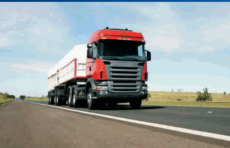
FINANCIAMENTO DE VEÍCULOS NOVOS E USADOS (%)